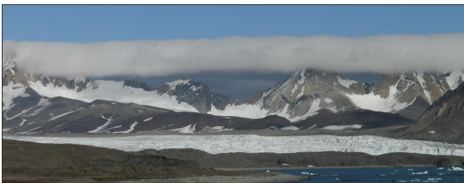
Ryc. 4. Wał fenowy ( Stratocumulus stratiformis ) nad Sofiekammen, 1 sierpnia 2009 r. Fig. 4. Foehn bank ( Stratocumulus stratiformis ) over Sofiekammen, August 1, 2009.

wygładzony wskutek bardzo silnego przepływu powietrza. Wał fenowy najczęściej był obserwowany nad grzbieciem Sofiekammen (ryc. 4) rozciągającym się w linii północ-południe ok. 10 km na wschód i północny-wschód od stacji. Jego częsta obecność tam uwarunkowana jest zdecydowaną przewagą występowania wiatru z kierunku wschodniego w Hornsundzie. Występowaniu wału fenowego nad Sofiekammen zazwyczaj towarzyszy układ rozległych chmur piętra niskiego ( Stratus i Stratocumulus ) po stronie dowietrznej. Strefa tych chmur jest wówczas widoczna z Polskiej Stacji Polarnej jako zwarta zasłona w głębi fiordu w kierunku wschodnim.