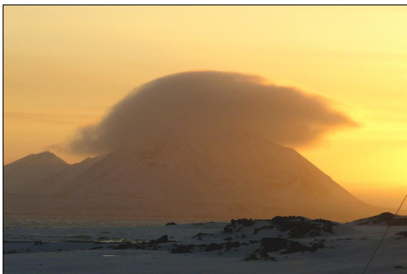
Ryc. 3. Czapa chmurowa ( Stratocumulus lenticularis ) nad masywem Hohenlohe, 24 października 2009 r.